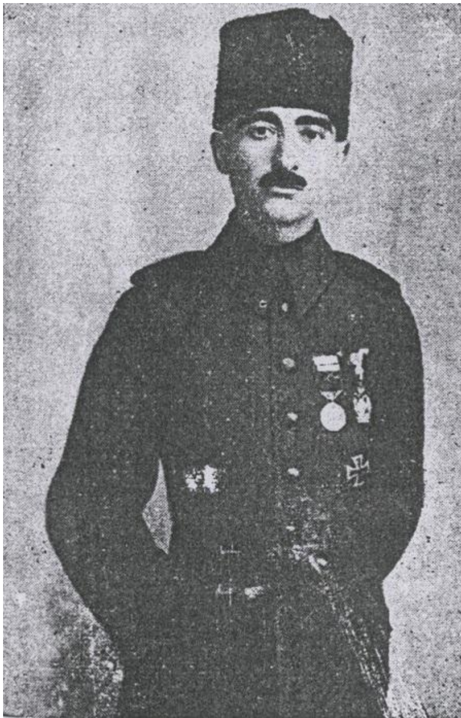
Halyl (Kut) paşa

Lourensiň taryhy rolunyň aşa çişirilýändigini öňe sürýän pikire görä berilen ýene bir mysal hem uruşdan soň araplara Lourensiň üsti bilen berilen ýeke wadasynyňam ýerine ýetirilmänligidir. Lourens özi bilen bile gozgalaňa gatnaşan taýpalara bir bitewi millet we döwlet wadasyny berenem bolsa, Birleşen Korollyk araplary millet derejesine ýetmedik taýpalar hökmünde görüpdür. Şonuň üçin gözegçilik astynda saklanmasy kyn, ýeke-täk we bir bitewi Arap döwletiniň ýerine Şerif Hüseyine we onuň ogullaryna dürli emirlikleri berip,