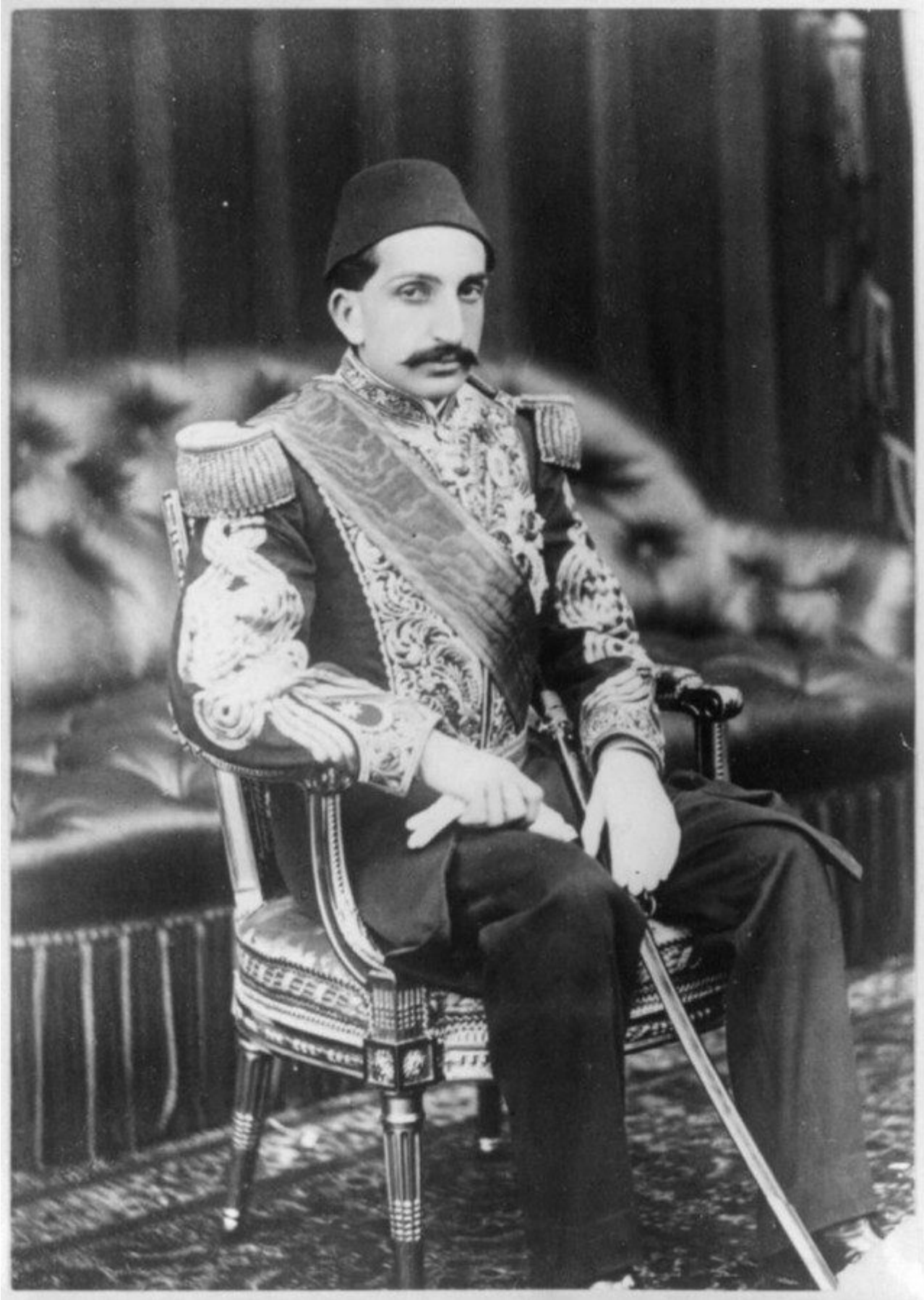
Soltan Abdylhamyt II

Soltan Abdulhamyt II sebitde bir bitewi milletçilik pikirinden