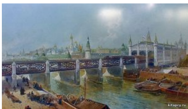
Иллюстрация к проекту московского метрополитена, 1902 год.

Дела Каразина оставили по себе достаточно глубокий след, чтобы остаться в памяти последующих поколений.