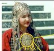
Гүнеý şekilli gäýşakaly türkmen gyzý. Nö aýy surat.